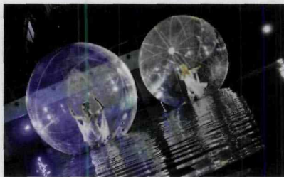
16 października – otwarcie Term Maltańskich

NAD JEZIEMEM MALTAŃSKIM ZAINAUGUROWAŁ DZIAŁALNOŚĆ JEDEN Z NAJWIĘKSZYCH I NAJNOWOCZEŚNIEJSZYCH KOMPLEKSÓW SPORTOWO-REKREACYJNYCH W POLSCE.